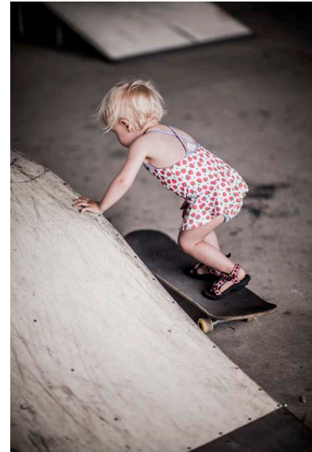
uit de reeks 'Lang leve het hangkind'