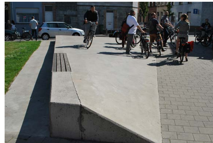
Rechts boven: Een voormalig kruispunt werd doormidden geknipt en een pleintje (met hellend vlak) werd ingericht. (Gijselsstraat en Rechtestraat)