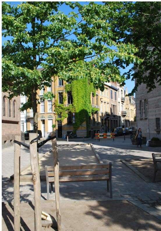
Links boven: De straat werd geknipt om het doorgaand verkeer af te wenden. Fietsers en wandelaars krijgen meer ruimte, en er werd een pleintje aangelegd. (Verzoeningsstraat/Laar)

Een goed speelruimtebeleid begint met een goede mobiliteit voor kinderen en jongeren. Er moet alleszins voldoende aandacht zijn voor voetgangers en fietsers (en bij uitbreiding voor skaters, skeeleraars...). Diverse kleine ingrepen kunnen een kindgericht mobiliteitsbeleid ondersteunen.