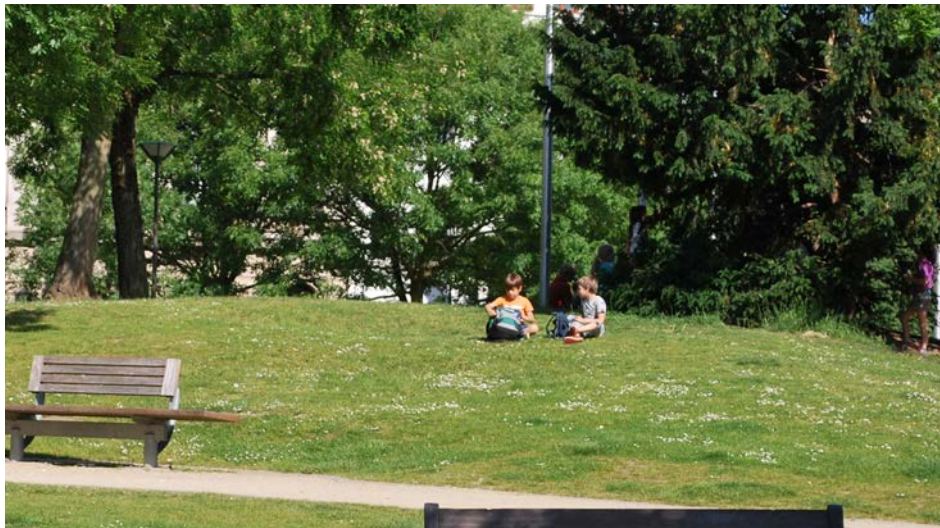
Hierboven: Een speelheuvel, chillplek, én een ideale plek om je boterhammen op te eten. (Krugerplein)

Eén misverstand probeert de stad alvast uit de wereld te helpen: een speelruimtebeleid ontwikkel je niet enkel met speeltoestellen. Met andere ingrepen en een gezonde dosis creativiteit slaagt men er in speel- en ontmoetingskansen te ontwikkelen.