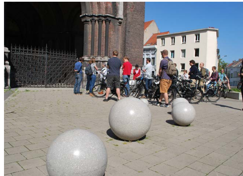
Onder: Speelse inrichting aan het kerkplein. (Sint-Jan-Evangelistkerk).